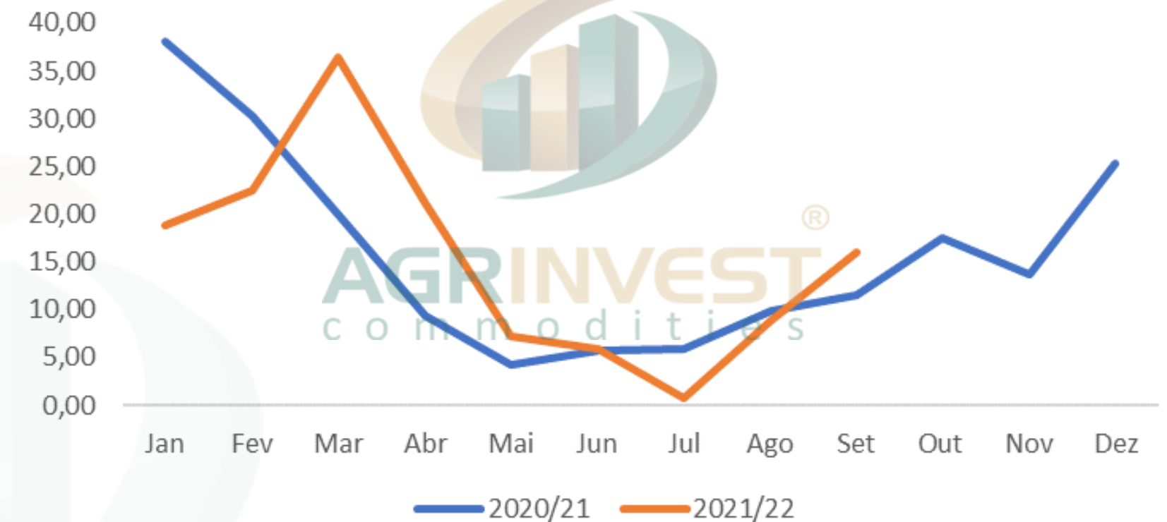
Exportação de Pluma Brasileira para o Paquistão (em mil toneladas)

E por falar em exportação, o mês de outubro fechou com 260,14 mil toneladas de pluma exportadas, maior volume mensal exportado em 2022. Até o momento, o acumulado para a safra 2021/22 chegou a 1,35 milhão de toneladas, contra 1,57 milhão de toneladas em 2020/21. Com relação ao preço, o cenário macroeconômico segue pressionando o mercado interno. Na semana passada, o algodão em NY acumulou uma queda de 8,8%, que refletiu diretamente nos preços brasileiros, mantendo o indicador Cepea abaixo dos R$ 5,00/LP.